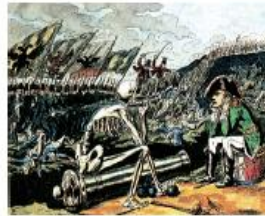
Napoleón frente a la muerte, luego de la batalla de Leipzig.