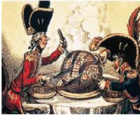
El premier británico William Pitt y Napoleón se reparten el mundo.

3 Observa y analiza las siguientes imágenes sobre acontecimientos políticos. Luego, responde las preguntas en tu cuaderno.